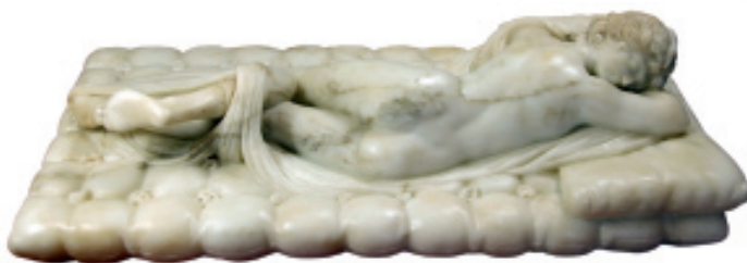
Hermafrodita Borghese. Còpia del segle XVIII d'un taller romà.