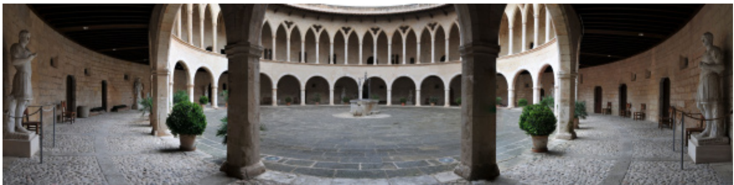
Pati d'armes.