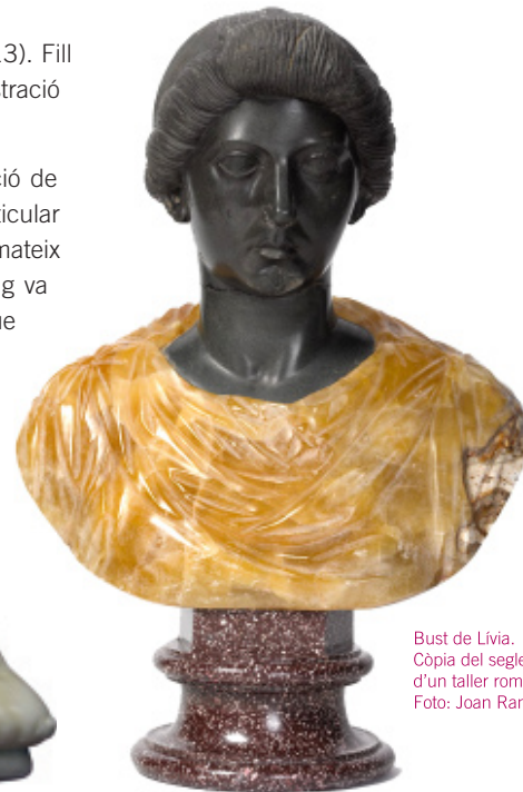
Bust de Livia. Còpia del segle XVIII d'un taller romà.

El Museu d'Història de la Ciutat allotja una part important d'aquesta col·lecció, adquirida per l'Ajuntament de Palma el 1923 gràcies a la intervenció de la Societat Arqueològica Lul·liana i d'un grup d'intel·lectuals mallorquins.