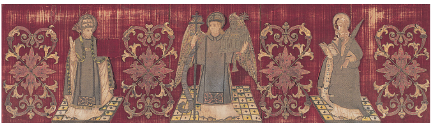
Frontal d'altar de la capella de Sant Marc, c.1550.