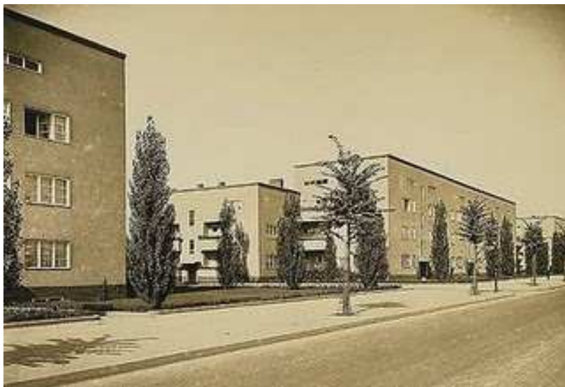
Afrikanische strasse. Berlin. Mies Van der Rohe 1925-27

El grup d'habitatges socials del Camp Redó amb la seva proposta d'illeta oberta, generant un espai urbà qualificat, la racionalitat de les distribucions en planta i la simplicitat compositiva de les façanes recull bona part de les conclusions sorgides del debat europeu sobre habitatge social d'entreguerres i evoca experiències anteriors i contemporànies de l'avantguarda arquitectònica europea (Afrikanische strasse. Berlin. Mies Van der Rohe 1925-27; Conjunt d'habitatges "Onkel Toms Hüte" de Bruno Taut i Otto Rudolf Salvisberg 1926)