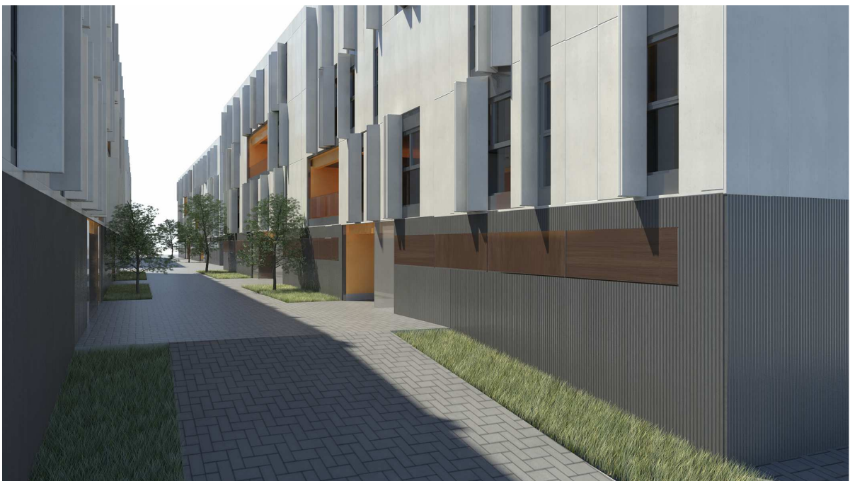
Imatges indicatives del projecte