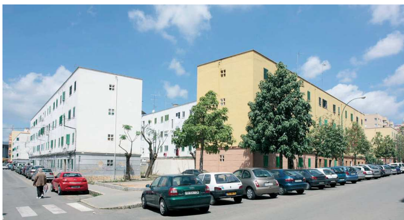
Grup d'Habitatges socials "Generalísimo Franco". Instituto Nacional de la Vivienda. Palma, 1954. Antoni Roca Cabanelles.